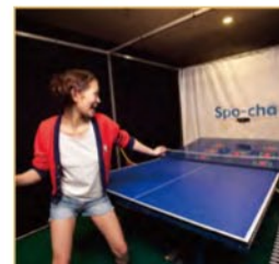
スマッシュピンポン Smash ping-pong