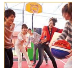
3 on 3 3 on 3