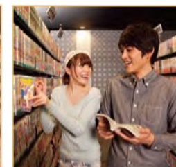
リラクゼーション&コミック Relaxation & comics