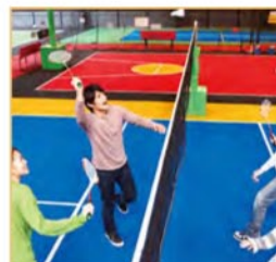
マルチコート Multi-use court(badminton,volleyball)