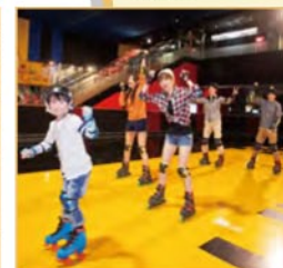
ローラースケート Roller skating