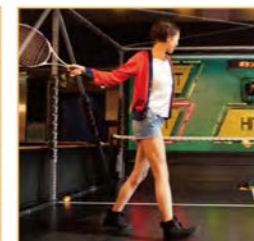
オートテニス Automatic tennis