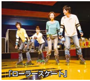
「ローラースケート」

友達や家族で遊ぶことのできる公園や空き地が少なくなってきた昨今、多種多様なスポーツアイテムで爽快に汗を流せるスペースを提供しています。また、リラクゼーションやゲームコーナーなども併設し、様々なニーズにお応えしているサービスです。 ※スポッチャ施設は、一部の店舗にはありません。下記サイトでご確認ください。