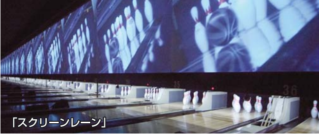
「スクリーンレーン」

当社のコア事業であり、独自の様々な企画を実施して、集客およびリピート率の向上に努めています。